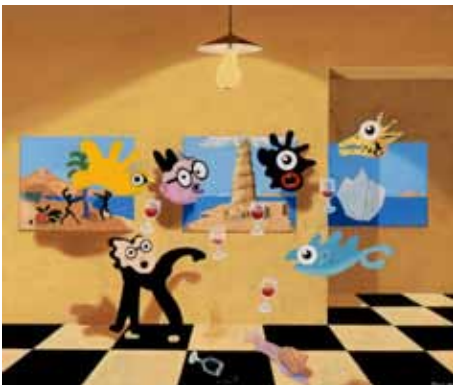
Die Experten 70/60