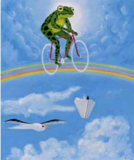
up in the sky 50/60