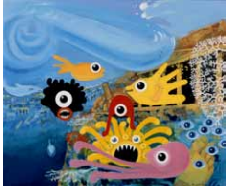
Das Riff 60/50